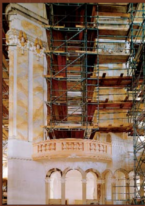
Роспись внутренних стен выполняется согласно тщательно разработанной цветовой концепции.