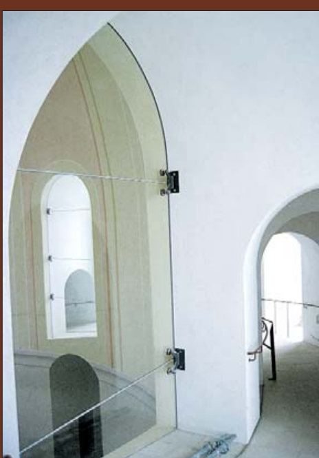
Застекленные полукружья окон на винтовой лестнице.

По пути вверх через застекленные полукружья стрельчатых окон можно заглянуть внутрь купола, а через отверстие в куполе – вниз во внутренний объем церкви.