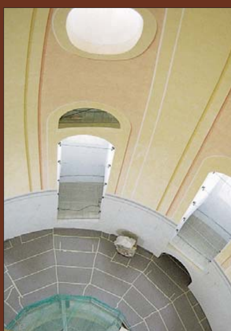
Противопожарные нормы и требования безопасности выполнены.