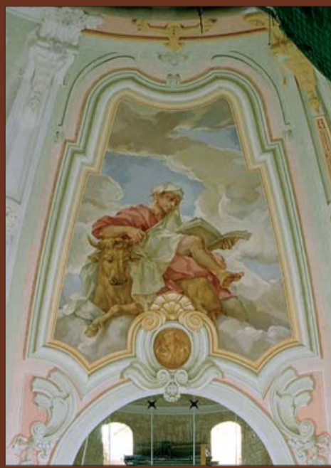
Художественная роспись внутри купола.