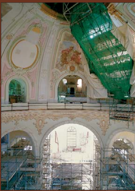
С подвесных лесов заканчивается отделка внутри купола Фрауэнкирхе.