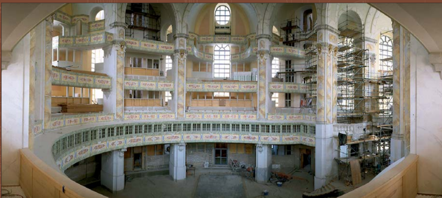
Внутренний вид церкви в 2004 году.