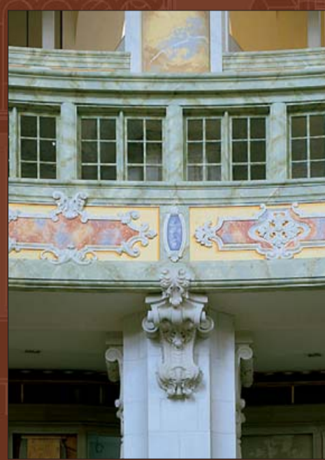
Законченные хоры исповедален полностью скрыли внутренние металлические конструкции.

Законченная к настоящему времени покраска под мрамор – результат многочисленных испытаний, начавшихся в 2001 году на пробной оси пилон F.