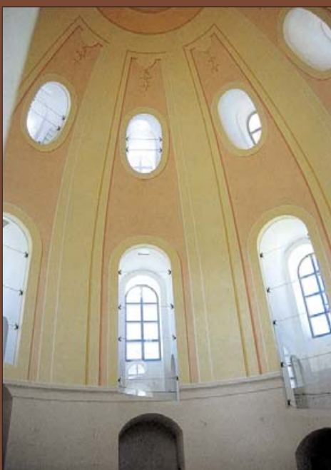
Четкость архитектурных линий и простота росписи главного купола.

Точечное крепление и система шин, утопленных в штукатурке, позволили выполнить остекление, обладающее звуко- и теплоизоляционными свойствами, без переплетов. Такое решение только улучшило внутреннюю эстетику купола.