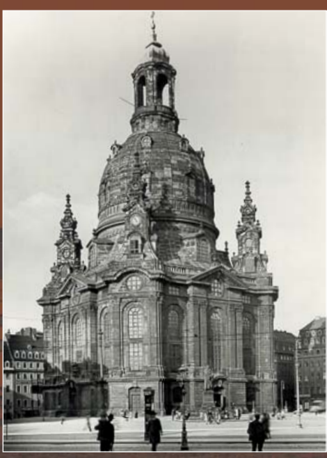
Историческая фотография церкви Фрауэнкирхе перед ее разрушением