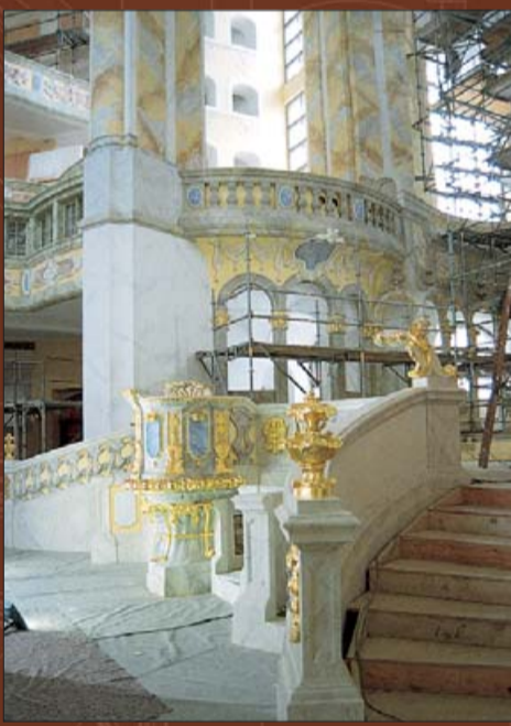
Лестница на ограждение хоров, восстановленных по историческому образцу.

Заказанное фондом Фрауэнкирхе цветное решение было уточнено рабочей группой и адаптировано к отдельным элементам. Работы опытных реставраторов и позолотчиков подлежат постоянному контролю.