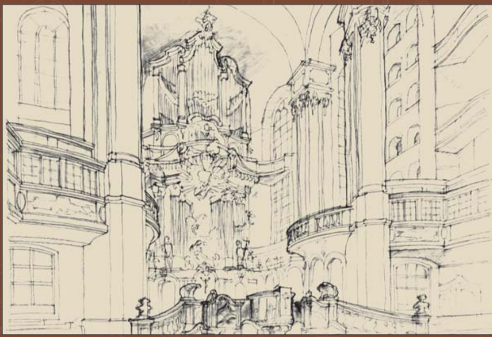
Эскиз перспективы алтаря архитектора IPRU Уве Кинда.