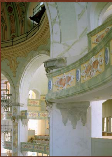
Штукатурные изыски и перспективная роспись внутри церкви.

Художники и позолотчики приходят самыми последними: только тогда, когда установлены «техническая начинка», оштукатурены стены и своды, а на них нанесен орнамент, когда закончены парапеты хоров.