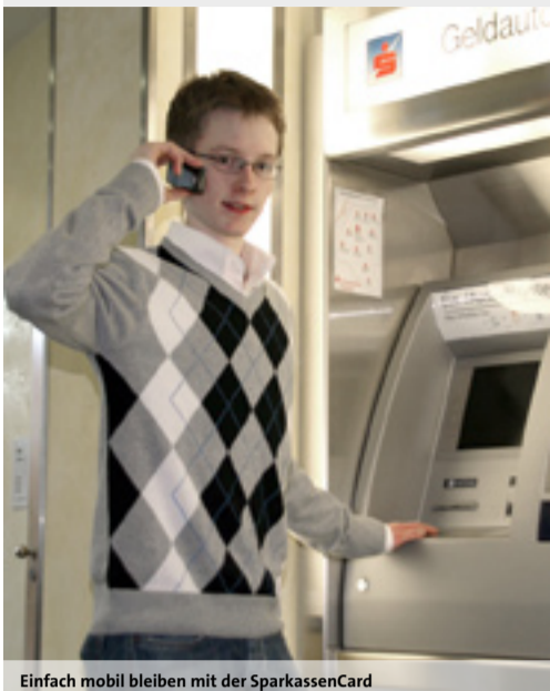
Einfach mobil bleiben mit der SparkassenCard